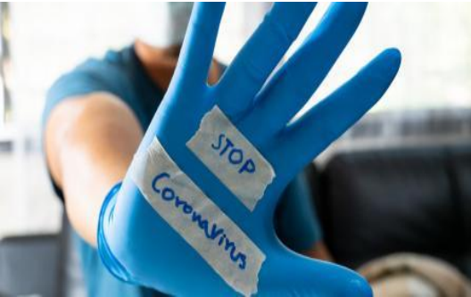
PANDEMIA DEL COVID 19