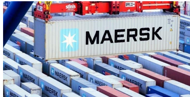
CRISIS DE CONTENEDORES