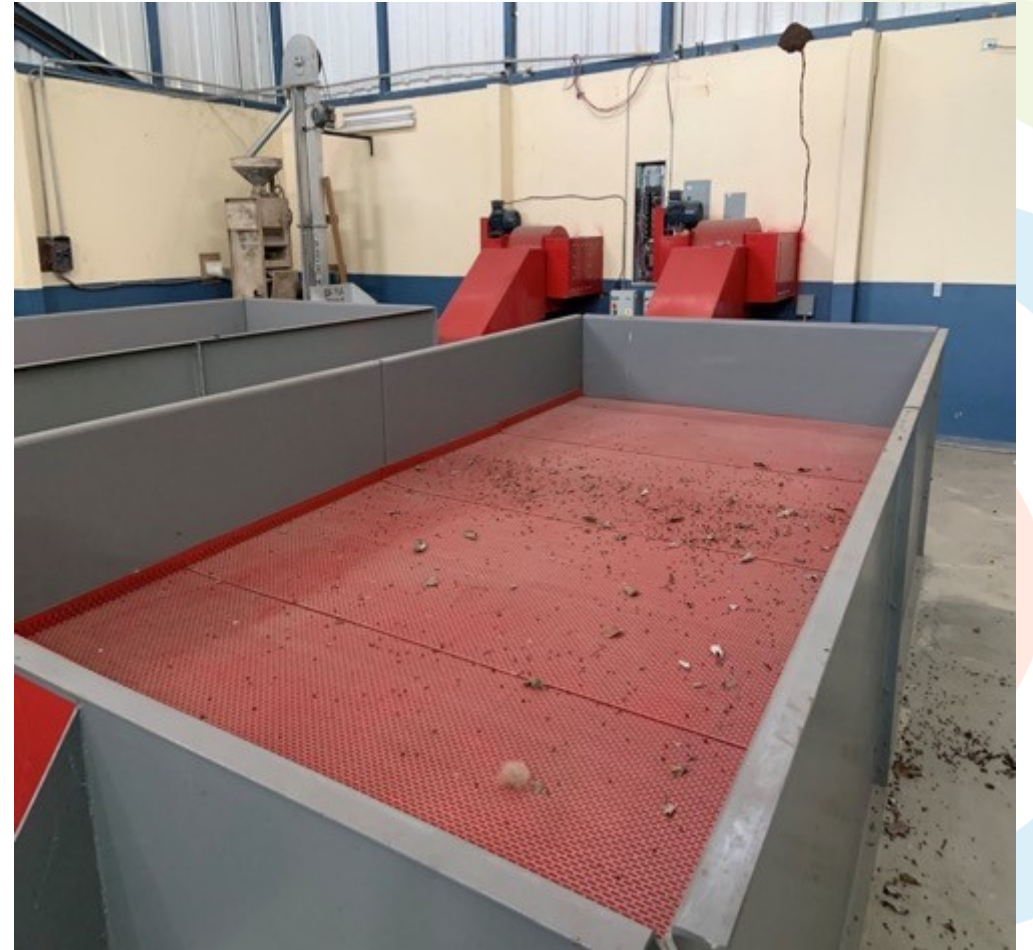
Centro de Procesamiento de Cacao, Paraíso, Sixaola.