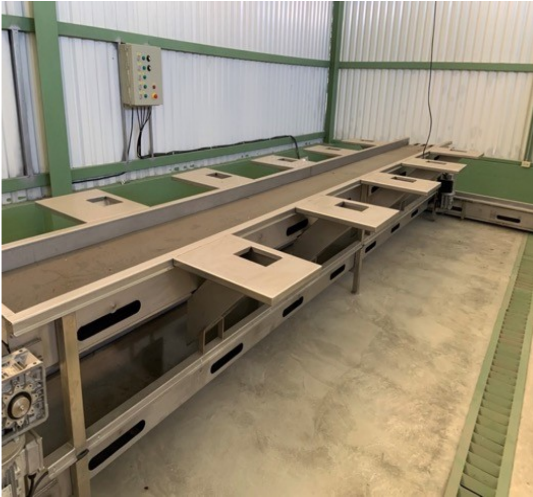
Planta Polivalente de Raíces Tropicales, Milano, Siquirres.